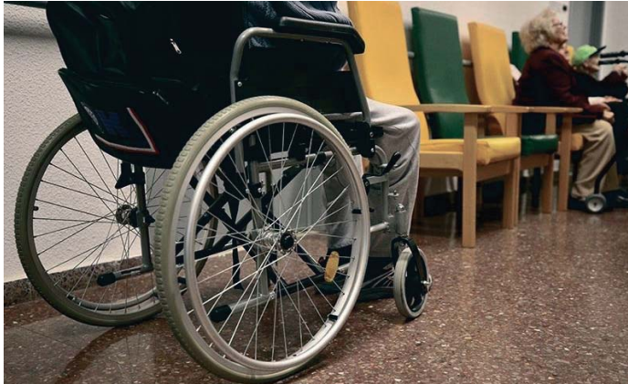
Sin una mejora en la financiación, algunos servicios esenciales dejarán de prestarse.

El malestar del sector creció tras el encuentro del 11 de septiembre entre los representantes de CERMI y el presidente de la Junta, Juan Manuel Moreno. Durante la reunión, Moreno alabó la labor de estas entidades, pero fue claro al explicar que no podía atender las demandas debido a las limitaciones financieras del Gobierno andaluz, que asegura estar "al tope de sus capacidades" en sectores como la sanidad, la educación y