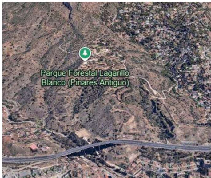
Vista aérea de la zona afectada por la construcción de las viviendas.

“No sabemos cuál es el plan de urbanización, porque no nos han dejado verlo, a pesar de que lo hemos pedido varias veces”, ha criticado el presidente. Por ello, teme que “van a usar” las redes de saneamiento “justas y viejas que ya hay”: “Dan averías cada dos por tres”. Por otro lado, se ha referido al agua potable. “Es la que hay”, la zona cuenta con “tres aljibes”, que “estaban calculados para un determi-