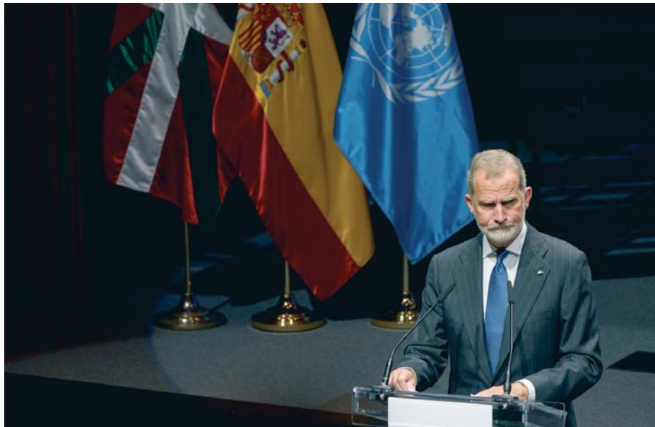
El rey Felipe VI durante su intervención en la Conferencia Internacional de Alto Nivel sobre Víctimas del Terrorismo.

VALENCIA. EFE | El rey Felipe VI elogió ayer el "compromiso con la libertad y la solidaridad" de las víctimas del terrorismo, a las que definió como un "faro ético para toda la sociedad" y cuyo testimonio debe llegar "en especial a los jóvenes" porque sirve para prevenir la violencia. El rey intervino en la Conferencia Internacional de Alto Nivel sobre Víctimas del Terrorismo que se celebra en Vitoria, donde se dirigió en inglés a las víctimas de terrorismo de todo el mundo y de todo tipo de motivación, a sus familiares y a las asociaciones presentes en el Congreso.