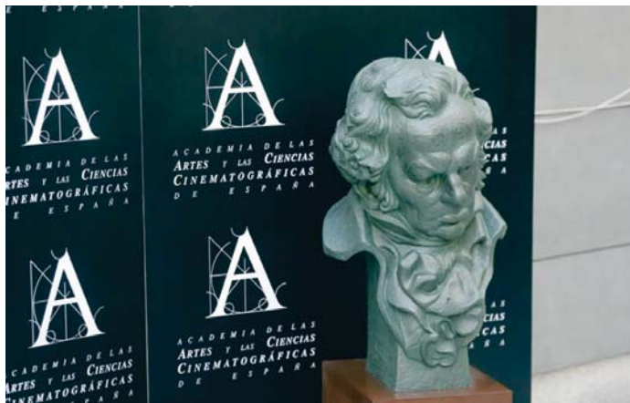
Reproducción a mayor escala de la estatuilla del Premio Goya.

El conjunto monumental de la Alhambra será protagonista de la ambientación urbana