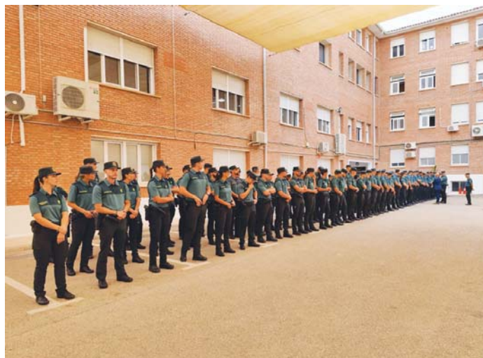
Un momento de la presentación de los nuevos efectivos, cuando se ha pasado revista a los agentes. ROCA

El subdelegado del Gobierno en Málaga ha recalcado que “se trata de la mayor incorporación de agentes de la Guardia Civil en la provincia de Málaga en los últimos 15 años, lo que da cuenta del compromiso del Gobierno de España para mejorar las plantillas de las Fuerzas y Cuerpos de Seguridad del Estado”. Salas también hizo hincapié en la importancia de mantener un equilibrio entre el aumento del personal y la actualización tecnológica y de infraestructuras, como parte del esfuerzo gene-