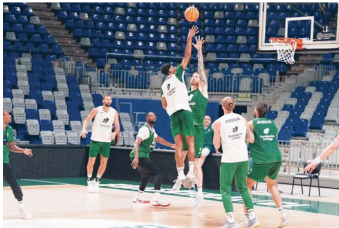
El Unicaja Málaga ya prepara su estreno en el Carpena para la BCL 2024-2025.

El King Szczecin se convertirá en el quinto equipo polaco al que se enfrentará el Unicaja en toda su historia. Antes, los malagueños se midieron al Mazowszanka Pruszkow (Copa Korac, 1996-97), al Slask Wrocław (Euroliga 2001-02), al Asseco Prokom Gdynia (Euroliga 2009-10 y 2012-13, y Eurocup 2019-20) y al Basket Zielona Góra (Euroliga 2013-14). En total,