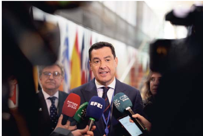
El presidente de la Junta, Juanma Moreno, atiende a los medios tras el pleno del Comité de Regiones.

En una breve intervención en el debate sobre las prioridades, en el Consejo de la UE, Moreno se refirió al cambio climático y al impacto que tie-