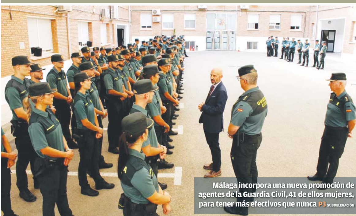
Málaga incorpora una nueva promoción de agentes de la Guardia Civil, 41 de ellos mujeres, para tener más efectivos que nunca P3 SUBDELEGACIÓN

ALERTAN La nueva promoción es un “despropósito” ambiental y aumentaría los problemas de movilidad y saneamiento en las urbanización actuales por lo que harán protestas NATURALEZA Se trata de una zona “especial en la que se tienen que hacer los mínimos movimientos de tierra y se debe respetar la fauna y flora autóctona”