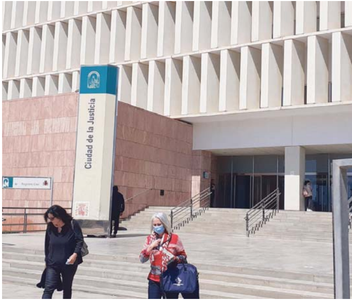
El acusado tenía antecedentes por violencia machista y ahora será juzgado por asesinato. ARROYO

El cadáver de la mujer apareció en el mar, en la playa entre Elviria y Las Chapas, decapitada, sin manos y con una gran incisión en el abdomen, que según el fiscal hizo para conseguir que se hundiera y evitar que pudiera ser