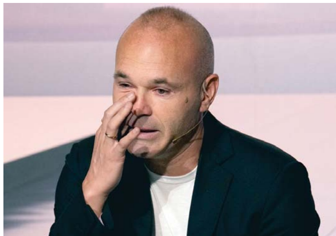
Andrés Iniesta durante la rueda de prensa que ofreció ayer en Barcelona.

Durante más de una hora, Iniesta repasó con los presentes una extensa carrera que le ha llevado a jugar hasta los 40 años y que empieza con ese viaje de Fuentebilla a Barcelona con 12. “La Masia me cambió para siempre. Es el lugar donde mejor podía estar para potenciar los valores que hay que tener en la vida. Y