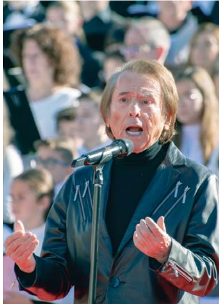
Raphael graba 'El Tamborilero' en Linares.