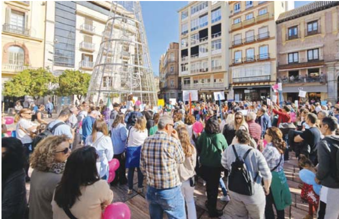
Un momento de la concentración que se ha desarrollado en la plaza de la Constitución.