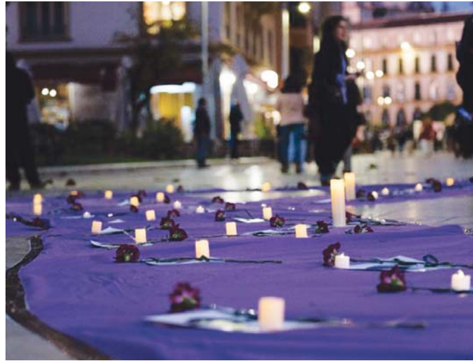
Imagen del gran lazo morado desplegado el pasado jueves en el centro de Málaga.

En total, el citado recurso ha atendido en Málaga un total de 9.462 llamadas hasta el pasado mes de octubre, lo que implica un incremento del 17,7% con respecto al mismo periodo de 2023 y supone que, en la actualidad, se reci-