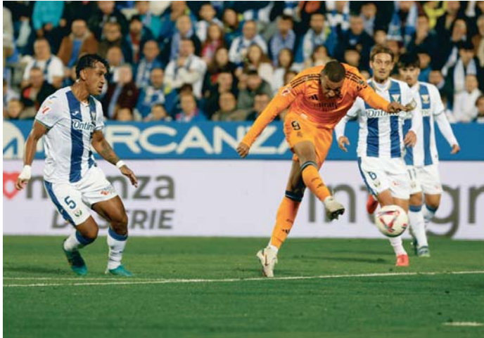
El delantero Kylian Mbappé (c) remata a puerta ante los jugadores de Leganés.

Un lanzamiento de falta de Valverde dispuso las esperanzas del equipo leganense de tratar de cambiar el rumbo (m.66), y un testarazo de Bellingham tras un balón al larguero (m.85) dio la puntilla a un partido en el que se vio a un