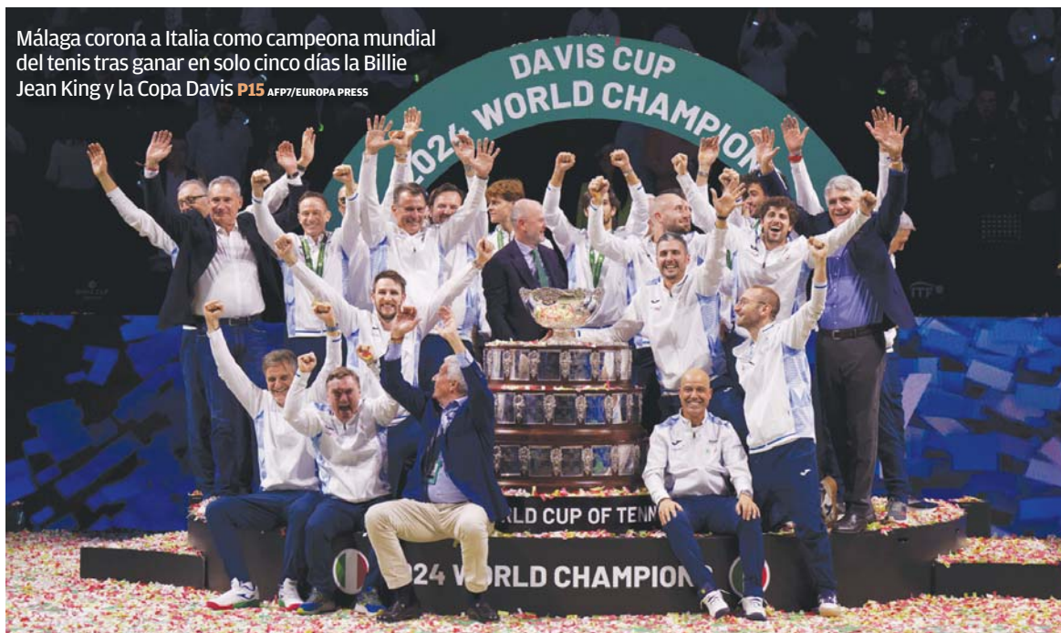
Málaga corona a Italia como campeona mundial del tenis tras ganar en solo cinco días la Billie Jean King y la Copa Davis P15

ATENCIÓN Las mujeres de nacionalidad española son las que dominan con un 89,7% de los casos atendidos