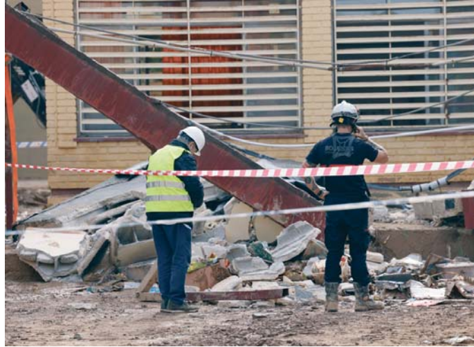
Bomberos en la zona colapsada en el colegio Lluís Vives de Massanassa (Valencia).

"Un suceso de estos te deja hoy más triste de lo que estamos", dijo Comes, quien in-