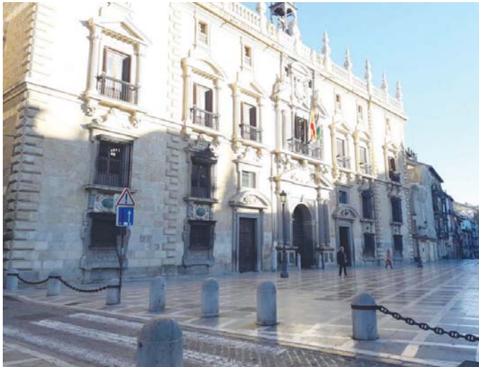
Fachada del TSJA en su sede de Granada, que ha dictado la sentencia

La defensa del inmigrante alegó que su patrocinado llevaba residiendo en España 18 años, y había disfrutado de permiso de residencia temporal, habiendo además tramitado la solicitud del permiso de residencia de larga duración, con la intención de justificar que su deseo era el de