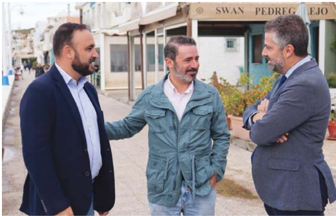
Los tres dirigentes populares en Pedregalejo, donde mostraron sus críticas al Gobierno central.

coherencia y el cinismo” del PSOE de Málaga, al tiempo que ha recordado que los socialistas malagueños “reclamaban esta remodelación al Gobierno de Rajoy y cuando llegaron al Gobierno, le dieron carpetazo”. Además, ha criticado que “ahora se laven definitivamente las manos y señalen a los ayuntamientos, que no tienen capacidad financiera para afrontar esos trabajos”.