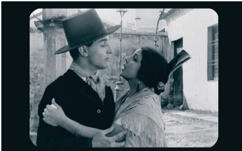
Protagonistas de la película 'Carceleras', adaptación de la zarzuela del músico valenciano Vicente Peydró. REPRODUCCIÓN