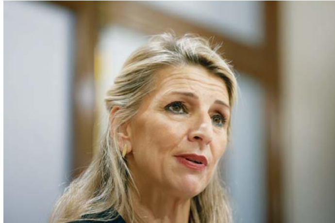
La vicepresidenta del Gobierno y fundadora de Sumar, Yolanda Díaz, en rueda de prensa.

Podemos se presentó dentro de la coalición de Sumar a las elecciones generales de julio de 2023, cuyas listas fueron publicadas en el Boletín Oficial del Estado (BOE) en el mes de mayo, antes por tanto de