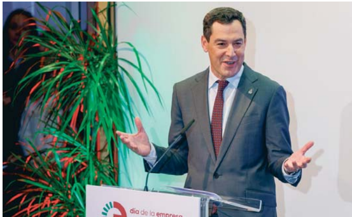
El presidente andaluz, Juanma Moreno, durante clausura de los actos del Día de la Empresa.

Los trabajos, según Moreno, comienzan en el mes de marzo de 2025 con una inversión de más de 3.000 millones de euros y un impacto de más de