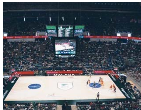
El Martín Carpena se queda sin baloncesto este mes. UNICAJA B. FOTOPRESS