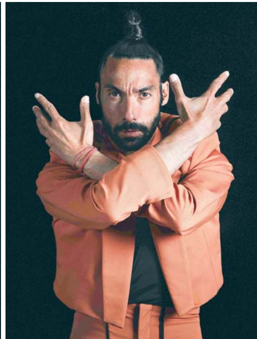
El bailaor gaditano Eduardo Guerrero.