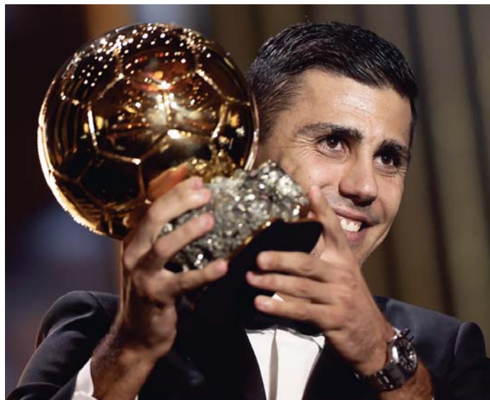
Rodrigo Hernández 'Rodri' posa con el Balón de Oro durante la gala en París.

Rodri, de 28 años, fue la pasada temporada una pieza clave en la selección española campeona de Europa y en el Manchester City, equipo con el que ha ganado cuatro Premier League consecuti-