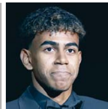
Lamine Yamal.

La futbolista española Jennifer Hermoso, jugadora del Tigres mexicano y de la selección española de fútbol, recibió el premio Sócrates por su trabajo a favor de la igualdad en el fútbol. Afirmó que las futbolistas del fútbol femenino luchan "para que las niñas tengan referentes".