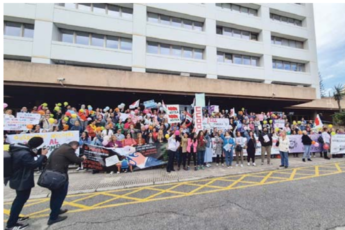
Un momento de la concentración vivida en la delegación de la Junta de Andalucía este lunes.